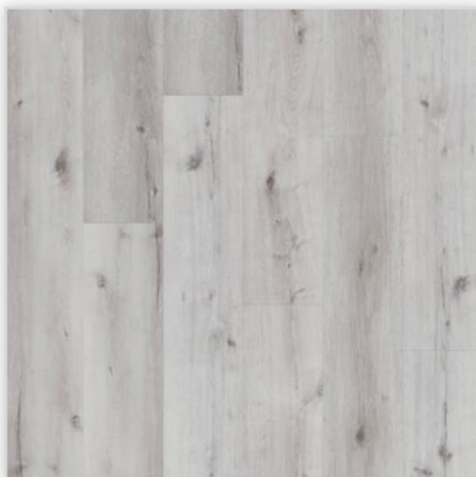
Kolekcja wineo 800 wood XL, do montażu na click, dekor Helsinki Rusic Oak, symbol DLC00068. Wymiary [mm]: 1505/237/5, warstwa użytkowa 0,55 mm, pełna deska, struktura Synchron. Klasa użytkowa: 23/42. Montaż: bezklejowy Connect. Podłoga jest dostępna również w wersji klejowej o grubości 2,5 mm.