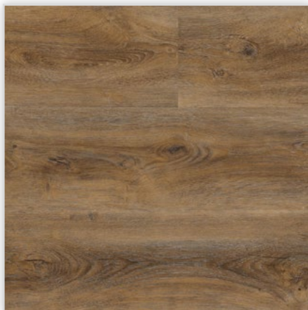
Kolekcja wineo 600 wood XL, do montażu na klej, dekor Aumera Oak Dark, symbol DB00027. Wymiary [mm]: 1505/235/2, warstwa użytkowa 0,4 mm, pełna deska, struktura Synchron. Klasa użytkowa: 23/41. Montaż: klejowy. Podłoga dostępna również w wersji bezklejowej Connect o grubości 5,0 mm.