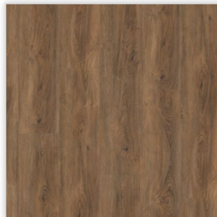
Kolekcja wineo 800 wood XL, do montażu na klej, dekor Cyprus Dark Oak, symbol DB00066. Wymiary [mm]: 1505/235/2,5, warstwa użytkowa 0,55 mm, pełna deska, struktura Synchron. Klasa użytkowa: 23/42. Montaż: klejowy. Podłoga jest dostępna również w wersji bezklejowej o grubości 5,00 mm.