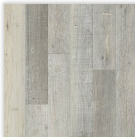
Kolekcja wineo 800 craft, do montażu na klej, dekor Infinity Light Mixed, symbol DB00072. Wymiary [mm]: 914,4/101,6/2,5, warstwa użytkowa 0,55 mm, pełna deska, wyczuwalna struktura drewna. Klasa użytkowa: 23/42. Montaż: klejowy.