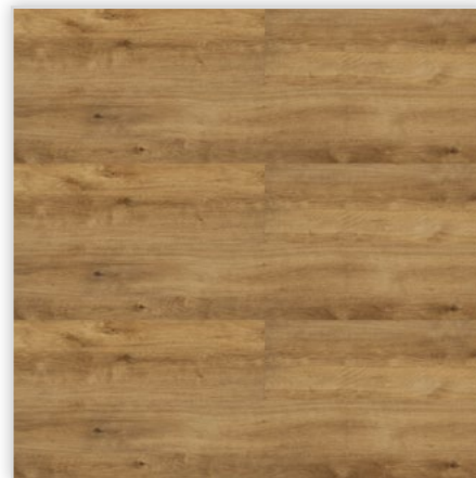
Kolekcja wineo 600 wood XL, do montażu na click, dekor Woodstock Honey, symbol DLC00023. Wymiary [mm]: 1505/237/5, warstwa użytkowa 0,4 mm, pełna deska, głęboka struktura drewna. Klasa użytkowa: 23/41. Montaż: bezklejowy Connect. Podłoga dostępna również w wersji klejowej o grubości 2,00 mm.