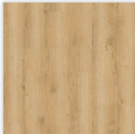
Kolekcja wineo 800 wood, do montażu na klej, dekor Wheat Golden Oak, symbol DB00080. Wymiary [mm]: 1200/180/2,5, warstwa użytkowa 0,55 mm, pełna deska, wyczuwalna struktura drewna. Klasa użytkowa: 23/42. Montaż: klejowy. Podłoga jest dostępna również w wersji bezklejowej o grubości 5,00 mm.