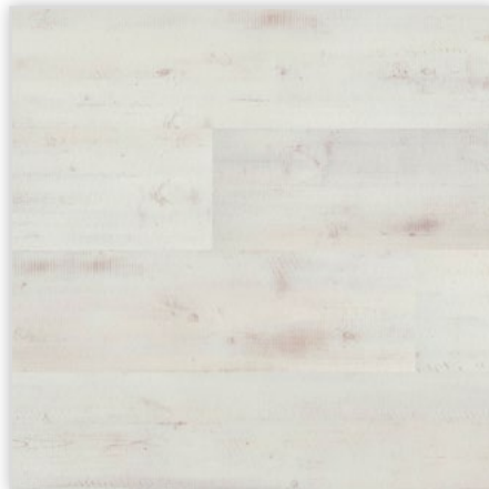
Kolekcja wineo 600 wood, do montażu na click, dekor Polaris, symbol DLC00012. Wymiary [mm]: 1212/187/5. Cechy: warstwa użytkowa 0,4 mm, pełna deska, wyczuwalna struktura typu Handscraped I. Klasa użytkowa: 23/41. Montaż: bezklejowy Connect. Podłoga dostępna również w wersji klejowej o grubości 2,00 mm.